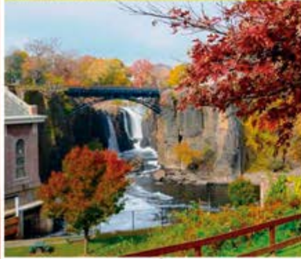
Cataratas Monumento Nacional Paterson