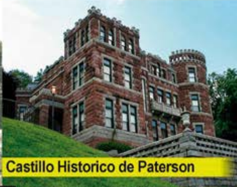
Castillo Historico de Paterson