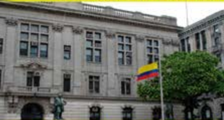
Parque Juan Pablo Duarte